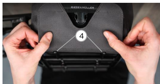
Abb. 4 / fig. 4