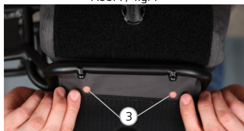
Abb. 3 / fig. 3