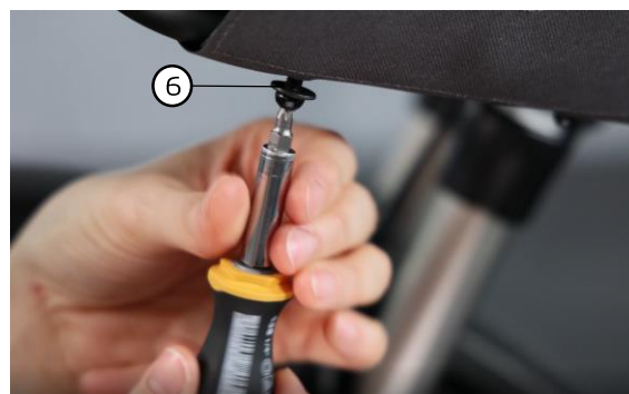
Abb. 6 / fig. 6