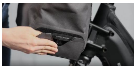
Abb. 2 / fig. 2