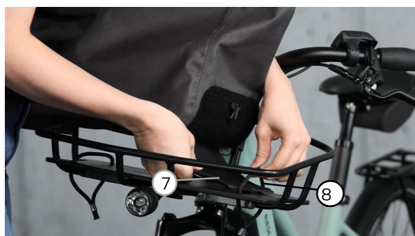
Abb. 7 / fig. 7