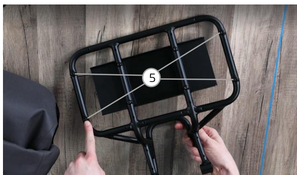
Abb. 5 / fig. 5

Flip over the velcro flaps and push them to the sides of the bag to temporarily fix them (fig.8).