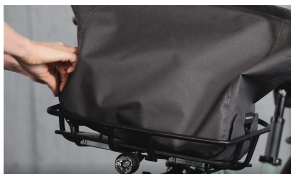
Abb. 8 / fig. 8