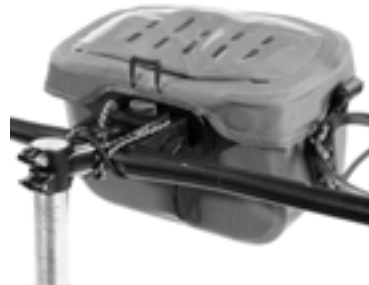
Anwendungsbeispiel mit Ultimate