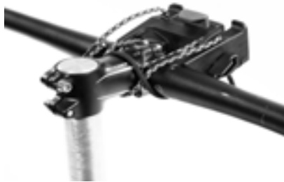
Ansicht im verbauten Zustand